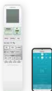
Možnosť ovládania prostredníctvom aplikácie

Komfortné infračervené diaľkové ovládanie s podsvieteným displejom, týždenným časovačom, funkciami tichej prevádzky a efektom podlahového kúrenia