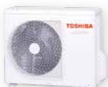
Vonkajšia jednotka (symbolické znázornenie)